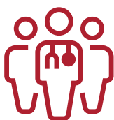
La coordination des intervenants médicaux par une IDE