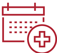
L'organisation des RDV médicaux