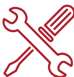
La petite maintenance