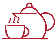
Le petit déjeuner , livré dans le logement chaque matin