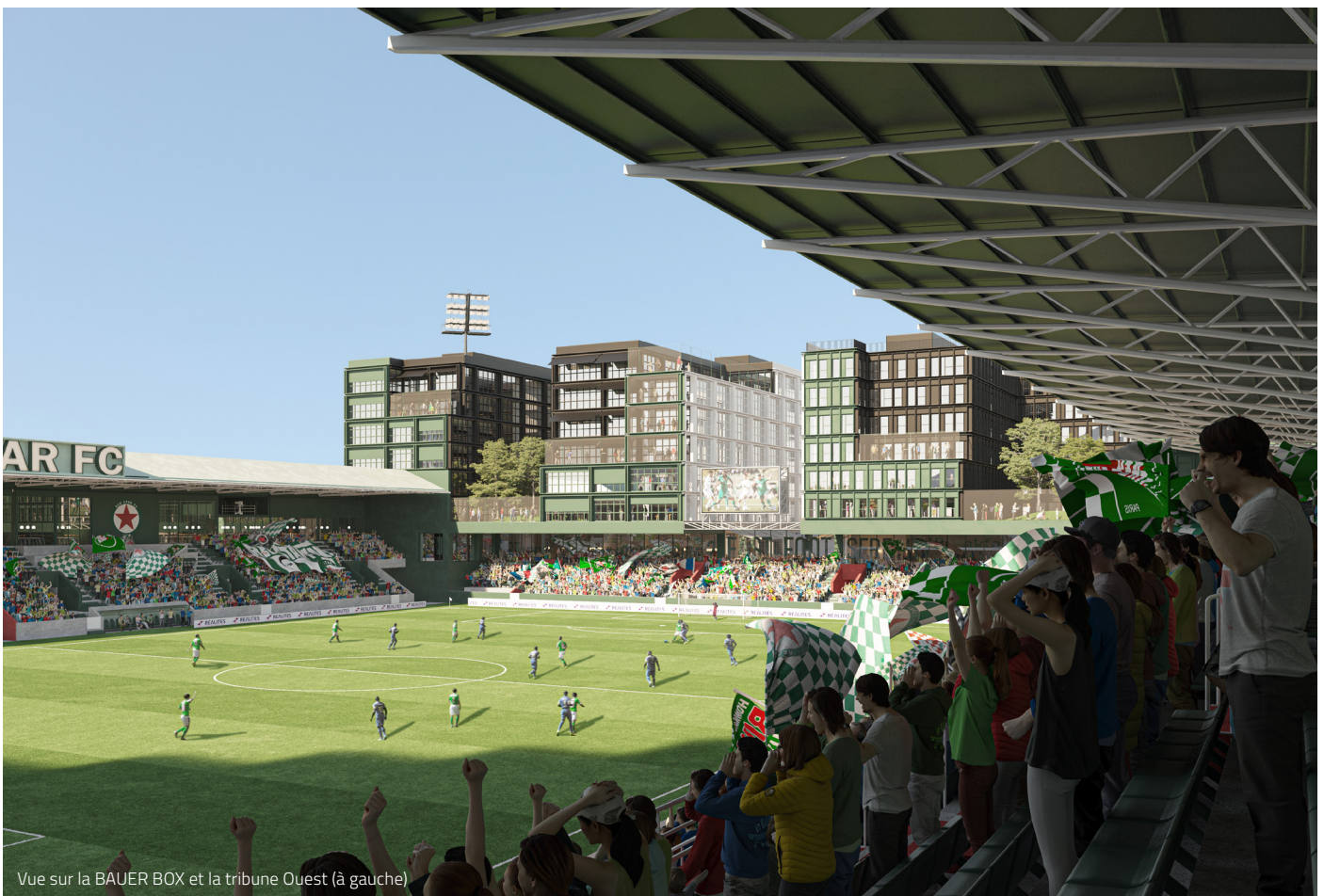
Vue sur la BAUER BOX et la tribune Ouest (à gauche)