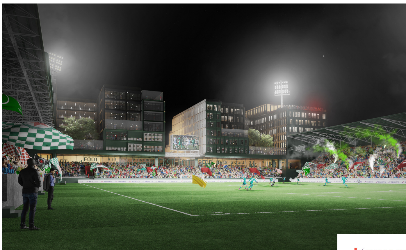
La BAUER BOX vue de la rue

« Le Stade BAUER est un site historique, authentique et atypique. Au plus proche des valeurs de l'agence Saguez&Partners, il est ancré dans le territoire de Saint-Ouen-sur-Seine, fidèle à son identité populaire et son militantisme social et culturel. Aux côtés des équipes REALITES et SCAU/CBA, Saguez&Partners est fier de participer à la transformation de ce stade iconique. Ce projet est l'occasion d'apporter un nouveau souffle à ce quartier et de marquer son empreinte urbaine sur la région en faisant rayonner son graphisme percutant, identitaire et énergétique. Il vient renforcer les liens avec les riverains en créant un lieu qui rassemble tous les milieux sociaux et toute la diversité du territoire : supporters, travailleurs, étudiants, joueurs, riverains, touristes, entreprises... Pour répondre aux attentes fortes des audoniens et franciliens, l'agence a enrichi le stade de nouveaux usages pour prendre soin de soi et des autres. Marqués par le sport et la culture urbaine, les espaces extérieurs seront évolutifs, ouverts à tous, à tout moment : les jours de match et d'événements comme le reste de la semaine. Le quartier se verra transformé en un terrain de jeu, de découvertes et de partage : liberté de créer, de bouger, d'apprendre, de courir, de danser, de chanter... Un espace à voir, à expérimenter et à partager tous ensemble ! »