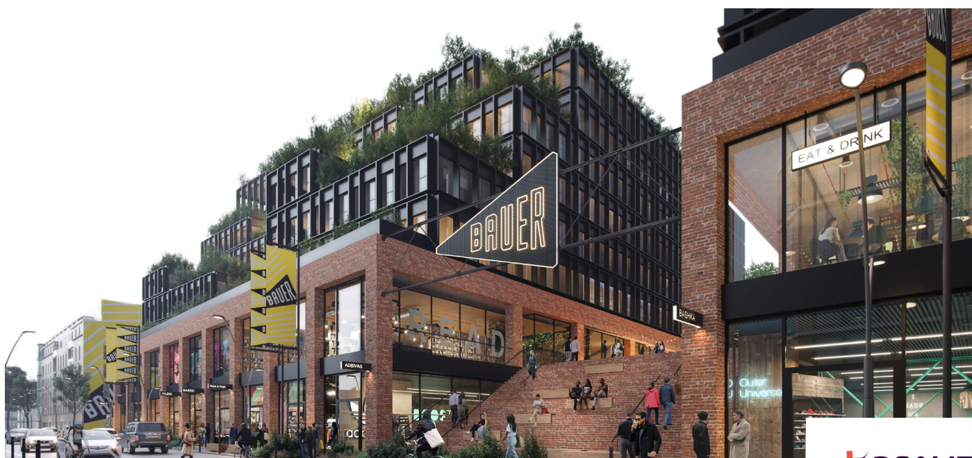
La BAUER BOX vue de la rue

« Un projet immobilier de 30 000 m 2 créateur d'emplois »